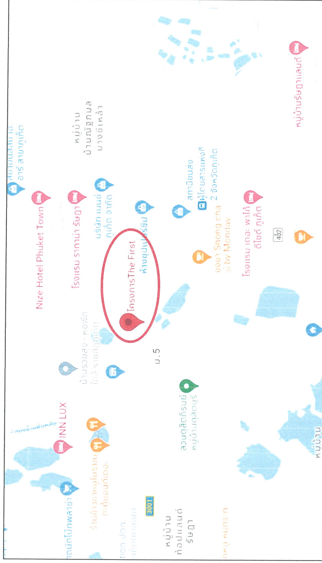
รูปภาพที่ 1.2 แผนที่ตั้งของโครงการ จัดสรรที่ดิน เดอะ เพิร์ส