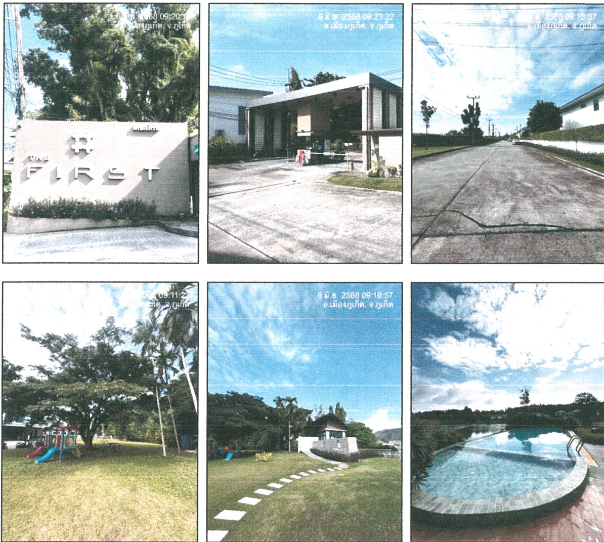
รูปภาพที่ 1.4 การใช้พื้นที่ของโครงการ